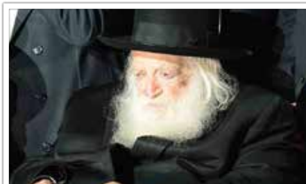
מרן הגר"ח קניבסקי שליט"א