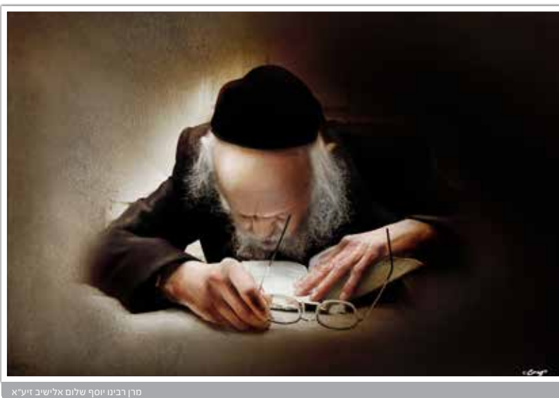
סוּחַ רבנו יוסף שלום אלישיב זיע"א

בזמנים כאלו לא היה רבנו מסוגל לעלות על משכבו וליתן לעיניו שינה; מצאת החג ישב, מחובר לגמרא בהתלהבות עילאית ולמד ללא הפסק