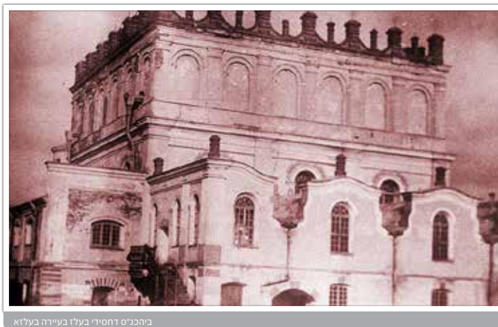
ביהכנסת דחסידי בעלז בניייה בעלזא