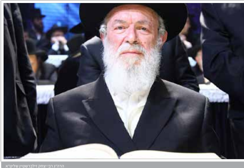
הרה"ג רבי יצחק זילברשטיין שליט"א

אם תחשוב באותם רגעים קשים, שהיצר אורב לך, כי בלימוד שלך אתה מתקרב אל בורא העולמים, מברך 'שהכל נהיה בדברו' - שכל ברכתך מתקיימות, "רצון יראיו יעשה", אז תראה כמה התורה הופכת להיות מתוקה, ותלמד באהבה, עד שיבוא יום והקושי שלך יהיה להתנתק ממנה.