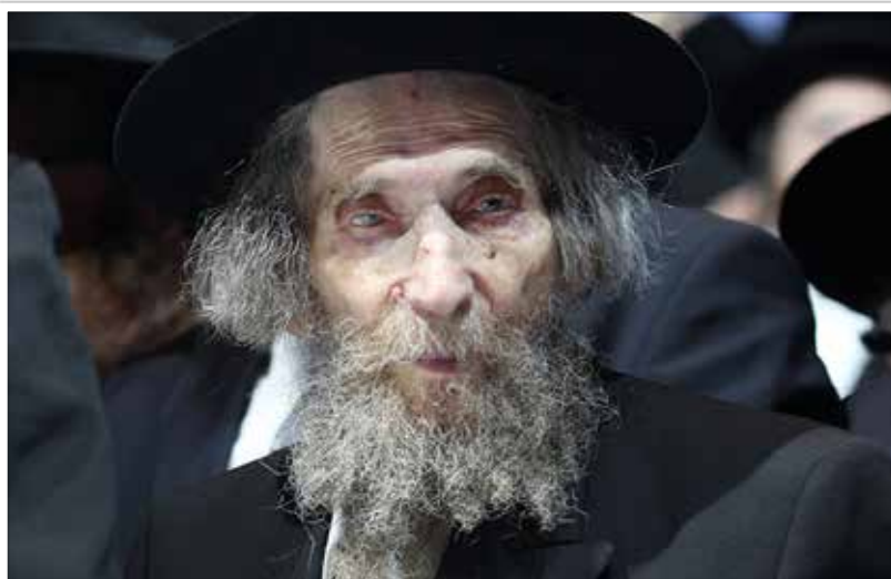
מרן הגראי"ל שטיינמן שליט"א

עובדא הוי בשמחת תורה בביהכנ"ס הרמב"ן ברובע היהודי ב-ים שבאמצע קריאת התורה בבית הכנסת קראו להגאון רבי א. שליט"א לחתן בראשית במנין השני, והסתפק מה עליו לעשות שהרי מבואר בשו"ע (סימן קמ"ו א) דאסור לצאת ולהניח ספר תורה כשהוא פתוח, ועל זה נאמר 'ועוזבי ה' יכלו' ולבסוף עזב באמצע